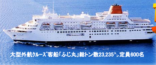
大型外航クルーズ客船「ふじ丸」総トン数23,235ト、定員600名