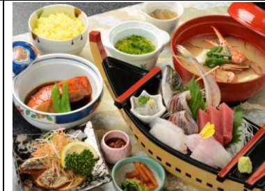
徳造丸魚庵昼食（イメージ）